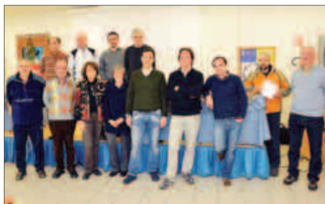
Foto di gruppo del direttivo uscente del Circolo di Montevaccino